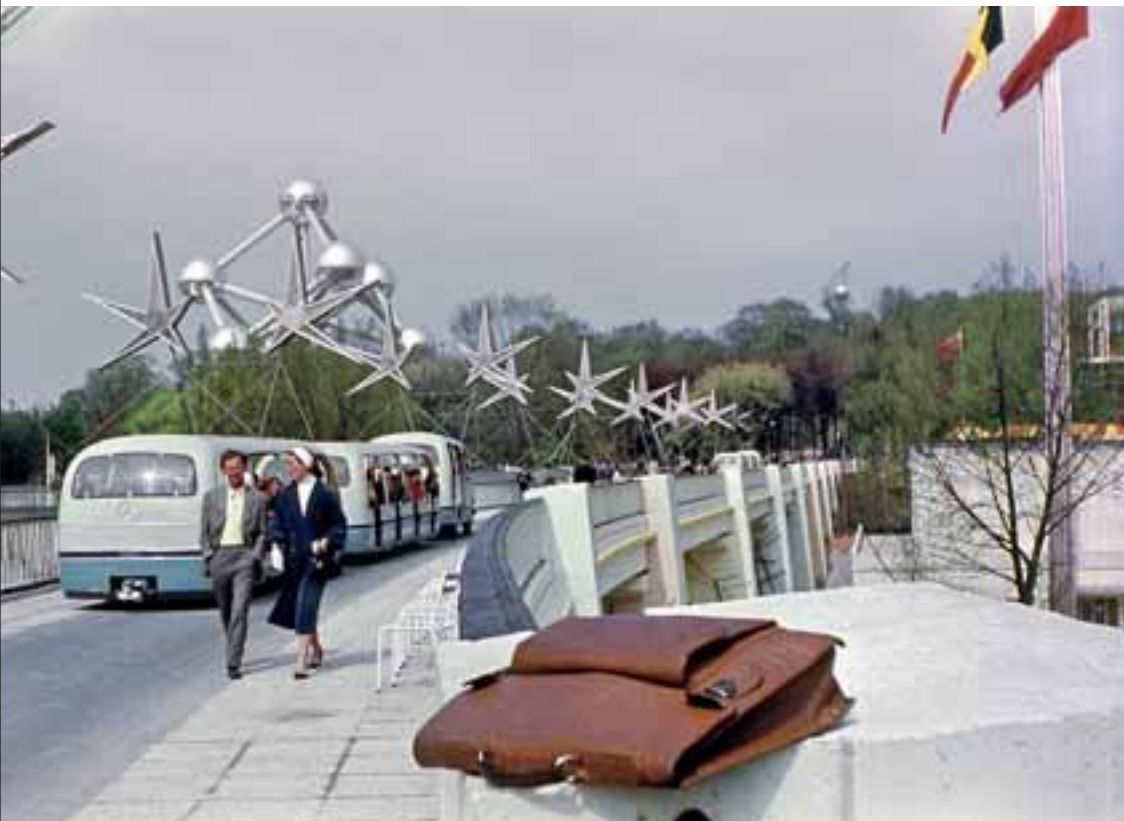
Příchod na výstaviště lemovaný dynamickými hvězdami – logem výstavy Luciena de Roecka, v pozadí Atomium