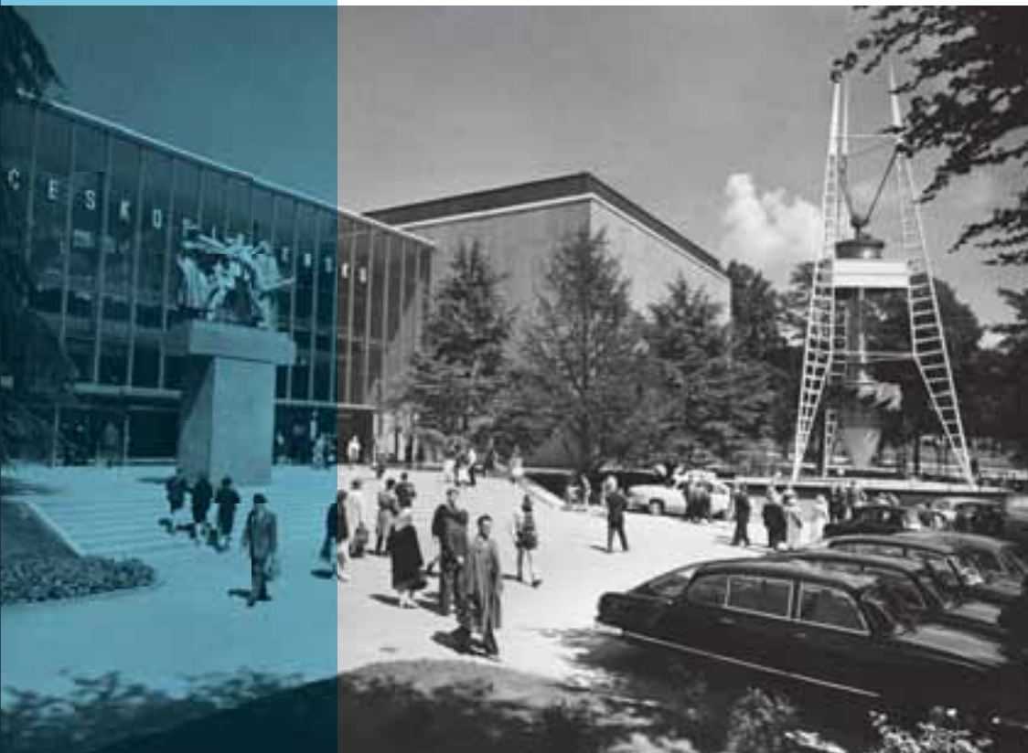
Průčelí československého pavilonu s pojízdnými exponáty – vozy Tatra 603 – v popředí